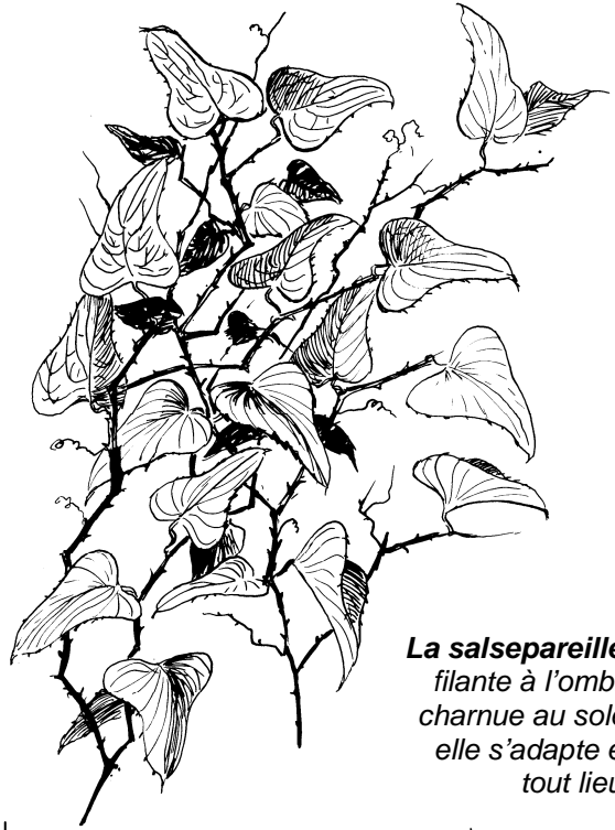
La salsepareille : filante à l'ombre charnue au soleil elle s'adapte en tout lieu !

Q23 (17/19) : La ronce de nos bois est la Salsepareille . C'est une espèce très commune de nos forêts méridionales, elle prolifère au milieu des combes et endroits ombragés, cependant les pentes ensoleillées ne lui font